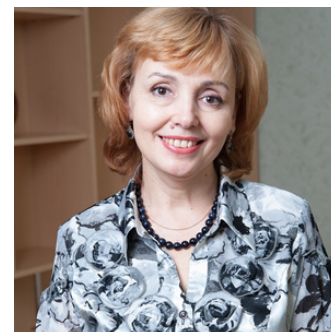
Tatiana POPA, vicepreședinte al Casei Naționale de Asigurări Sociale a Republicii Moldova