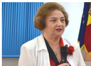
Ala MIRONIC, deputat în Parlamentul Republicii Moldova

Am venit în această sală, la festivitatea, prilejuită de aniversarea a 25-a a Academiei de Administrare Publică, cu toate acele sentimente și amintiri plăcute despre anii când am fost rector al acestei instituții unice din sistemul de învățământ superior din țară