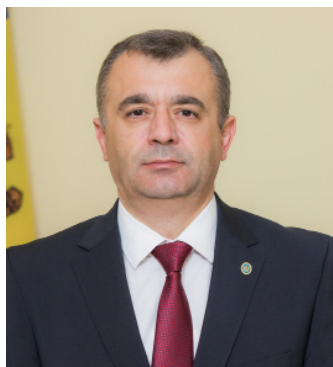
Ion CHICU, Prim-ministru al Republicii Moldova

Experiența acumulată pe parcursul celor 27 de ani de activitate a Academiei denotă că cercetările științifice efectuate sunt axate pe necesitățile sistemului național al administrației publice, constituind un suport important al procesului de reformare continuă și modernizare a acestuia. Prin studierea practicilor țărilor avansate în domeniul administrației publice, adaptarea și implementarea acestora în Republica Moldova, Academia de Administrare Publică a contribuit la dezvoltarea unui domeniu nou de cercetare pentru comunitatea științifică din Republica Moldova - cel al „Științei Administrației”.