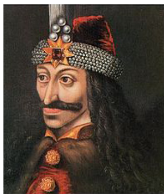
Vlad Țepeș Voievod

Pentru a înțelege tăcerea ce domnește în cronici în privirea Basarabiei în veacul al șaisprezecelea va trebui să permitem câteva considerațiuni de o natură mai generală.