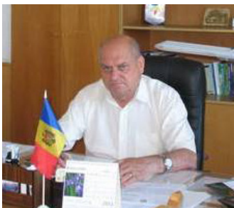
Președintele raionului Telenești, Boris Burcă

Prin această decizie a sa - de a declara anul 2012, Anul calității în prestarea serviciilor publice - administrația raionului Telenești și-a propus un plan complex de eficientizare a activității funcționarilor publici pentru a asigura o dezvoltare durabilă social-economică a raionului și a manifesta o permanentă grijă față de oameni, de bunăstarea lor.