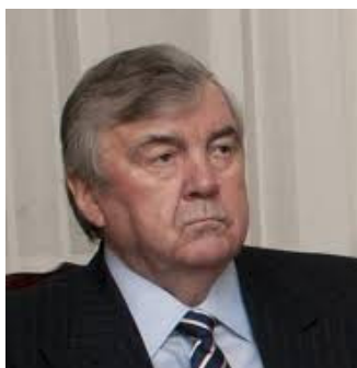
Mircea SNEGUR, primul Președinte al Republicii Moldova