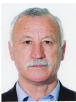
Vasile DOGA, primar al orașului Sângerei

Este mult de lucru pentru a face ordine în domeniul patrimoniului public și este îmbucurător faptul că sunt luate măsuri adecvate în acest sens, dovadă fiind și acest forum, care, credem, va fi un pas serios înainte pe calea evidenței stricte și corecte a patrimoniului public – un bun incontestabil al întregii societăți.