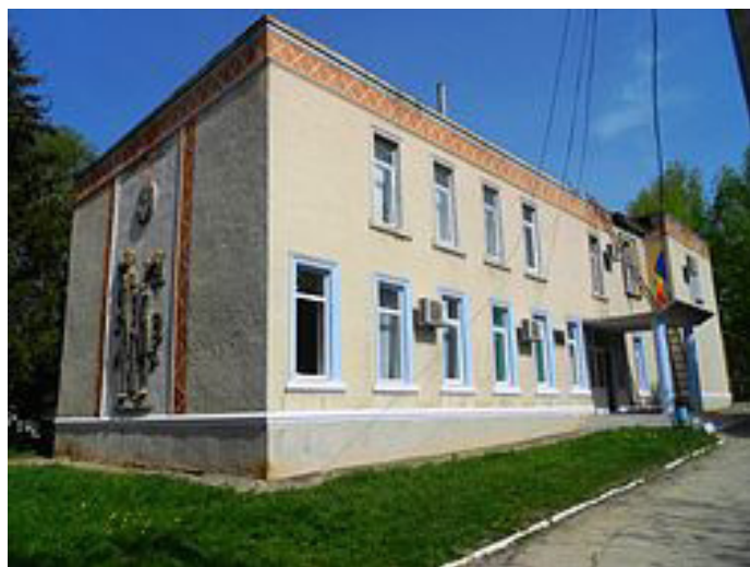
Primăria comunei Târnova, raionul Dondușeni

satului. Mai mult decât atât. A fost implementat un amplu proiect de iluminare stradală, fiind instalate 300 de felinare, ceea ce îi redă, într-o anumită măsură, un aspect de localitate urbană.