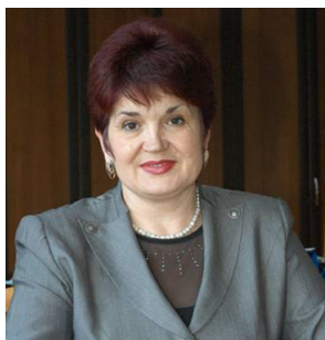
Valentina BULIGA, ministru al muncii, protecției sociale și familiei din Republica Moldova

După cum spune o vorbă înțeleaptă, sănătatea oamenilor este principala bogăție a țării. De aceea, am hotărât să merg și eu pe această cale, adică să-mi asum responsabilitatea de a sta la straja sănătății oamenilor și am absolvit Universitatea de Medicină și Farmacie „Nicolae Testemițanu”, specialitatea farmacie (obținând diploma de mențiune - n. red.) Mi-am început activitatea în calitate de farmacist-dirigințe la Spitalul raional Fălești și la Farmacia centrală din Fălești, fiind de baștină din satul Horești al aceluiași raion. Aici am activat timp de cinci ani, dar setea de cunoștințe și cercetările permanente în domeniu m-au adus la Chișinău, fiind angajată la Ministerul Sănătății și Institutul Național de Farmacie.