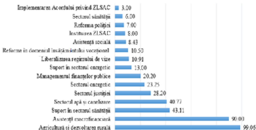
Figura 2. Valoarea debursărilor Uniunii Europene pentru Republica Moldova la capitolul asistenței macrofinanciare și programelor de suport bugetar în perioada 2009-2017 (mil. euro).

Plățile efectuate în cadrul programului AMF propuse depind strict de realizarea unor progrese importante în cadrul programului FMI și de punerea în aplicare a condițiilor de politică specifice, care sunt convenite între