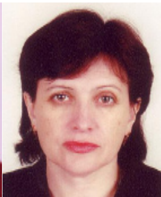
magistru, lector supe- rior