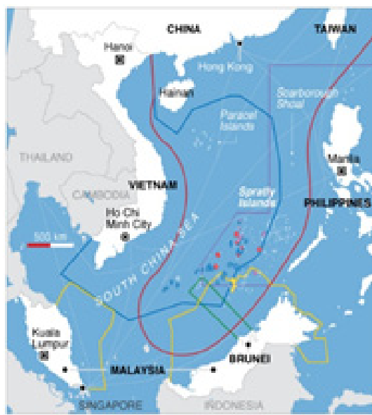
Fig. 4. Arhipelagul Spratly.

giei în regiune. La nivel regional, luând în considerare eventualele încercări ale țărilor - participanții la Uniunea Europeană, pentru a reduce cantitatea de energie livrată din Rusia pe trasee tradiționale, cu consecințe atât pentru furnizorii cât și țările de tranzit.