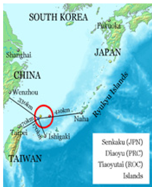
Fig. 3. Arhipelagul Senkaku (Arhipelagul Diaoyu).

Problema cu caracter regional, care provoacă îngrijorare pentru participanții la are-