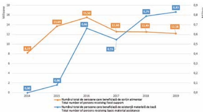
Figura 1. Numărul de persoane care beneficiază de sprijin alimentar și/sau asistență materială de bază (milioane)

more), and FI (34 229 more). Conversely, 17 Member States recorded a reduced number of end recipients, especially IT (594 297 fewer than in 2018), EL (70 961), as well as CZ, BG, PL and SK. Furthermore, RO continues to face implementation issues (see below).