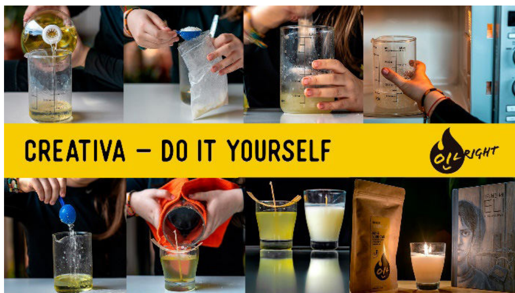
Foto 2: Procesul de realizare a unei lumânări din ulei uzat, în propria bucătărie. Autor: Cristian Țecu

The OilRight candle is the meaningful product that was missing from the Romanian market. In the current context, in which we spend more and more time at home, the need to have a warm, bright and safe space becomes more and more important. This can be solved by purchasing the candle as an