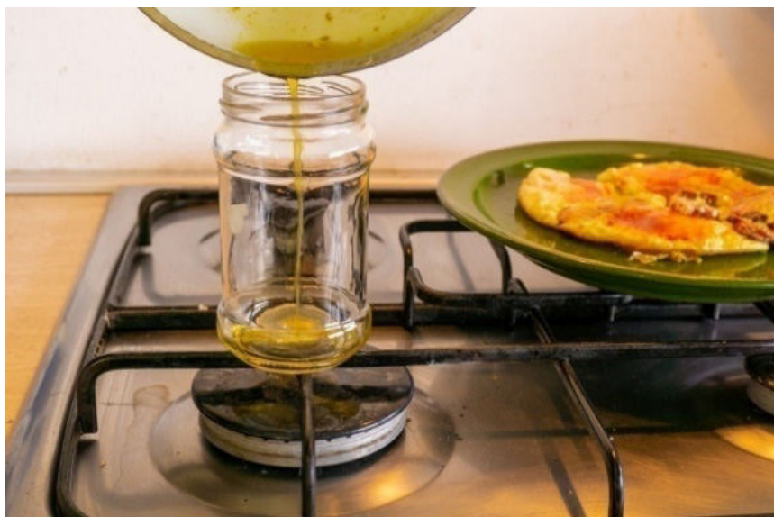
Photo 1: Used cooking oil collection. Foto 1: Colectarea uleiului alimentar uzat.

Romania has the second lowest recycling rate (and the third lowest collection rate) in Europe. One of the most polluting type of waste, gener-