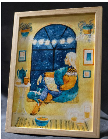
Foto 5: Serenita. Autor: Dan Ungureanu. Photo 5: Serenita. Author: Dan Ungureanu.

mală și devin din asistați social, contribuitori în comunitate. Pornind de la crezul că nu ne putem permite, ca societate, să continuăm fără empatie față de grupurile vulnerabile, îi avem aproape și pe cei de la Asociația Ceva de Spus , care ne educă pe noi toți cu privire la teme importante cum ar fi incluziunea, accesul egal și respectarea drepturilor.