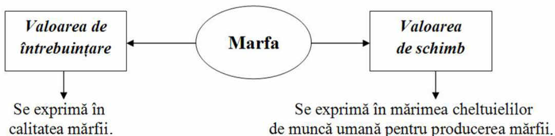
Schema 1. Marfa și proprietățile sale.

Pentru a deveni mărfuri, bunurile trebuie să dispună de utilitate, respectiv, să satisfacă o nevoie sau alta a omului. Dar nu orice bun care are utilitate poate deveni marfă. Pentru a fi marfă, el trebuie să