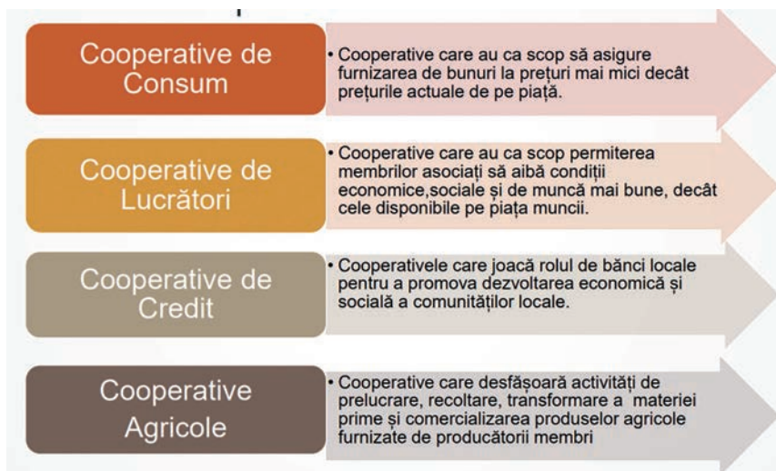
Figura 1. Modele de cooperative în economia socială a Italiei

Social cooperatives have become essential in the process of developing the social economy by broadening the concept and standard parameters of volunteer organizations, providing basic social assistance services and integrating disadvantaged people into society. Social cooperatives are promising solutions to change the social assistance system, demonstrating more profitable ways than previous financial benefits and trying to mobilize resources that would otherwise be unproductive. Compared to other