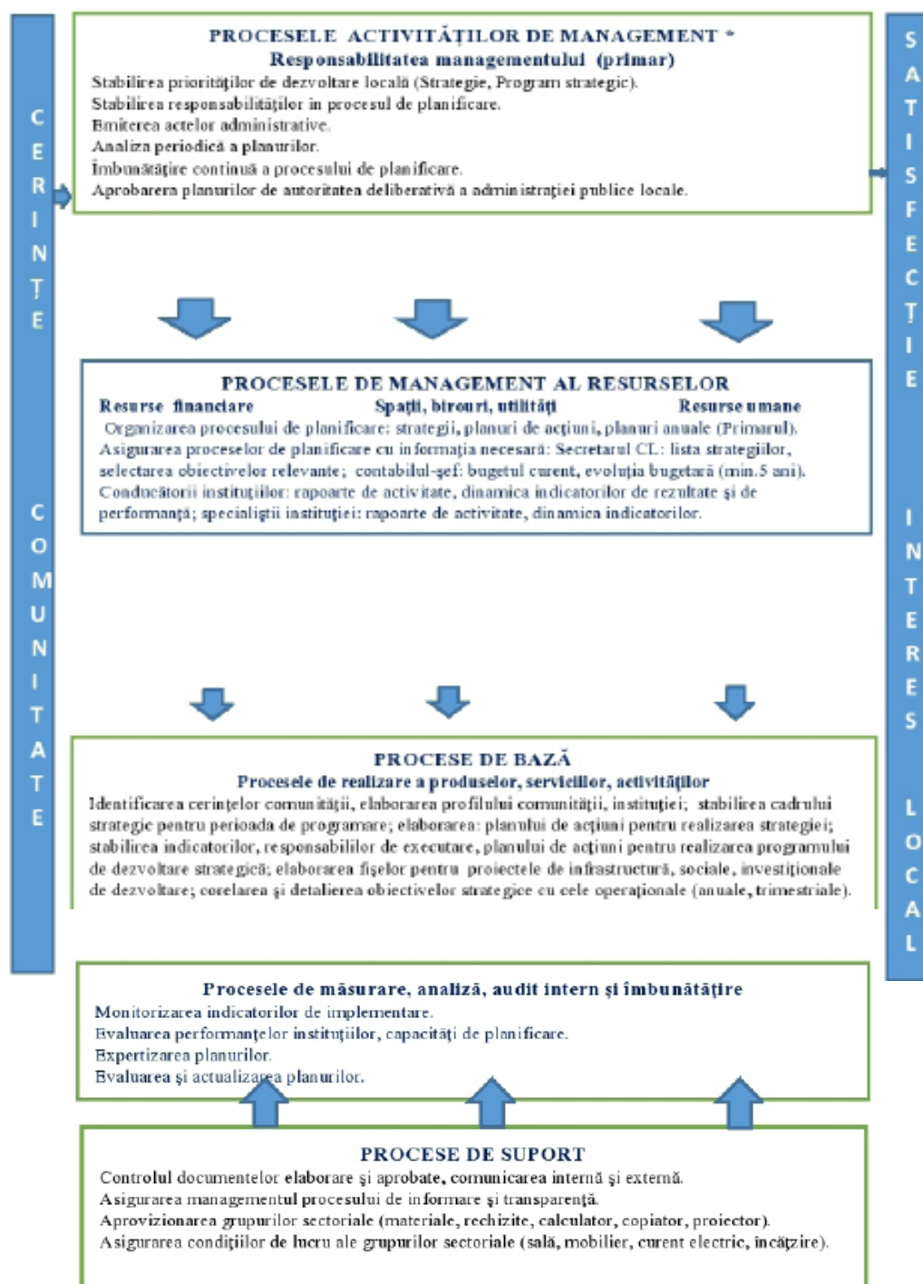
Figura 2. Harta proceselor de planificare în APL.